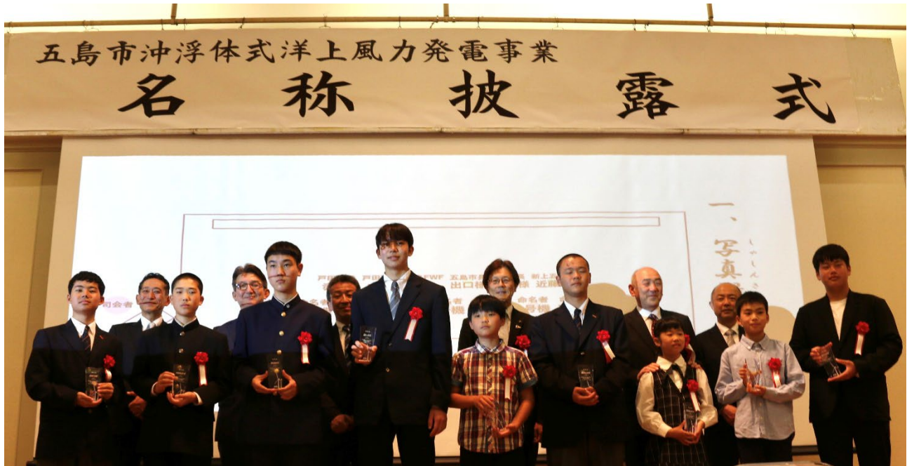
写真 3 名称披露式 記念写真