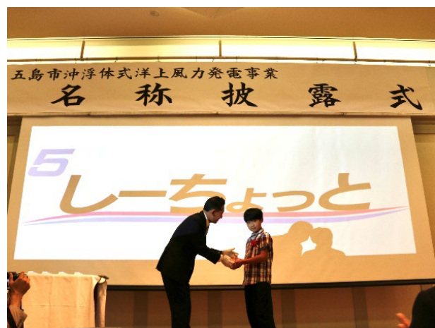
写真 1・2 記念品贈呈の様子