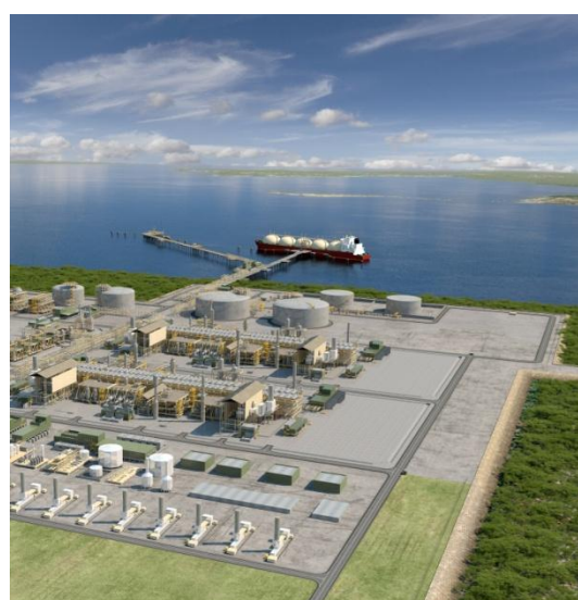
オーストラリア ダーウィンにおける液化天然ガス (LNG) プラント建設イメージ図