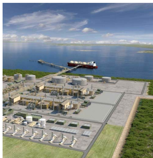
オーストラリア ダーウィンにおける液化天然ガス (LNG) プラント建設イメージ図