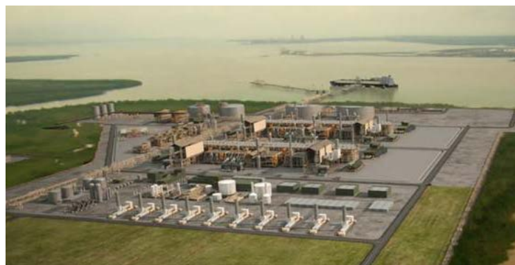
オーストラリア ダーウィンにおける液化天然ガス (LNG) プラント建設イメージ図